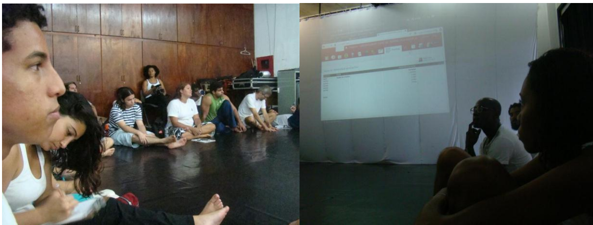
Figura 1: Discussão sobre como utilizar o Corais no Teatro Vila Velha, Salvador, Brasil