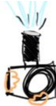
rebatendo no teto

Quando utiliza-se o flash Vertical, reduz mais essa luz dura. Normalmente o direcional lateral funciona melhor.